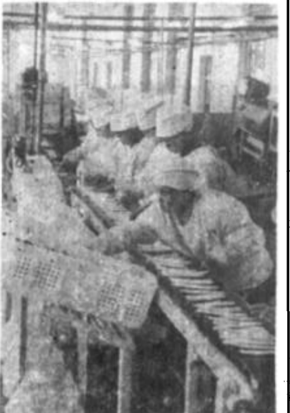
图为中外合资利津三利食品有限公司芦笋罐头生产线一瞥。

本报讯 利津县大力组织开展“管理效益年”活动，经济的运行质量得到进一步提高。上半年，预计全县国民生产总值4.2亿元，同比增长41.7%，工农业总产值8.09亿元，同比增长49%；财政收入完成1700万元，同比增长26.4%。外贸出口收购额完成7582万元，增长35.4%。全县乡及乡以上独立核算工业企业，实现产品销售收入22302万元，利税1259万元，比去年同期分别增长67.62%、35.67%；其中利润总额488万元，增长70.03%。部分综合经济效益指标比去年同期有较大改善。他们的主要做法是：靠强化管理，挖掘企业内部潜力。突出抓了二个关键问题：一是围绕改制抓管理，以管促“转”。他们设计并实施了“资产增值、产业优化、机制转换、人员分流、经济发展、社会稳定”的24字配套改革方案，重点抓了改革内部管理机制、压缩非生产人员等6项配套改革工作。208家县乡改制企业效益显著提高。二是围绕资金管理，以管“造血”和“活血”功能。一方面组织有关部门逐企业、逐产品摸清底子，列出单子，选准路子，对平销产品实行了以销定产，对处于滞销的产品，坚决予以“砍杀”。1—6月份，全县产成品存货减少1800万元，下降21.5%；另一方面，用“铁面孔”控制非生产性开支。坚决杜绝挥霍浪费资金的现象，使生产资金到位。把有限的资金用到企业生产经营上。上半年，全县工业企业非生产性开支比去年同期下降11.5%。 靠技术管理，以技术进步求发展。他们采取“送出去”、“请进来”的方法，对职工进行全员培训，促进了全县技术改造步伐的加快。上半年，全县工业企业已批复立项的技改项目69个，总投资11083万元，实现完成投资6190万元。这些项目全部投产后，可年增产值3.6亿元、利税4500万元。省管项目石油化工厂7万吨灵活双效催化裂化，总投资4581万元，现正顺利实施，预计明年“五·一”投产；市管项目纺织总厂的1200头气流纺纱，总投资680万元，已全部完成并投入生产。靠提高效率，为经济发展提供更好的服务。